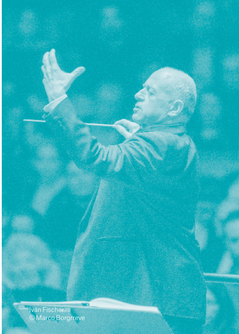
Iván Fischer