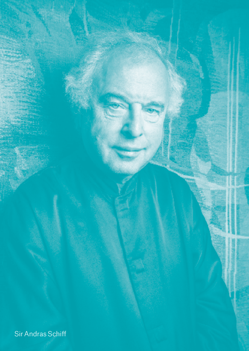
Sir Andras Schiff