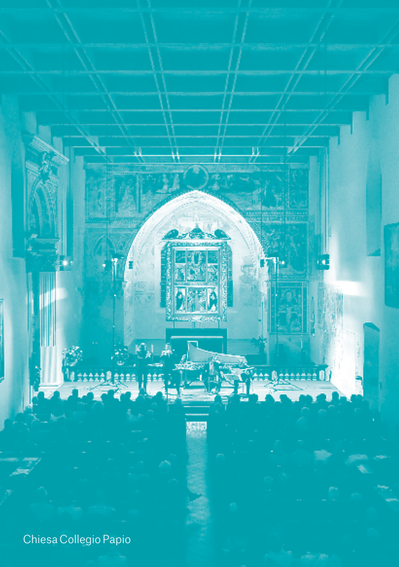
Chiesa Collegio Papio