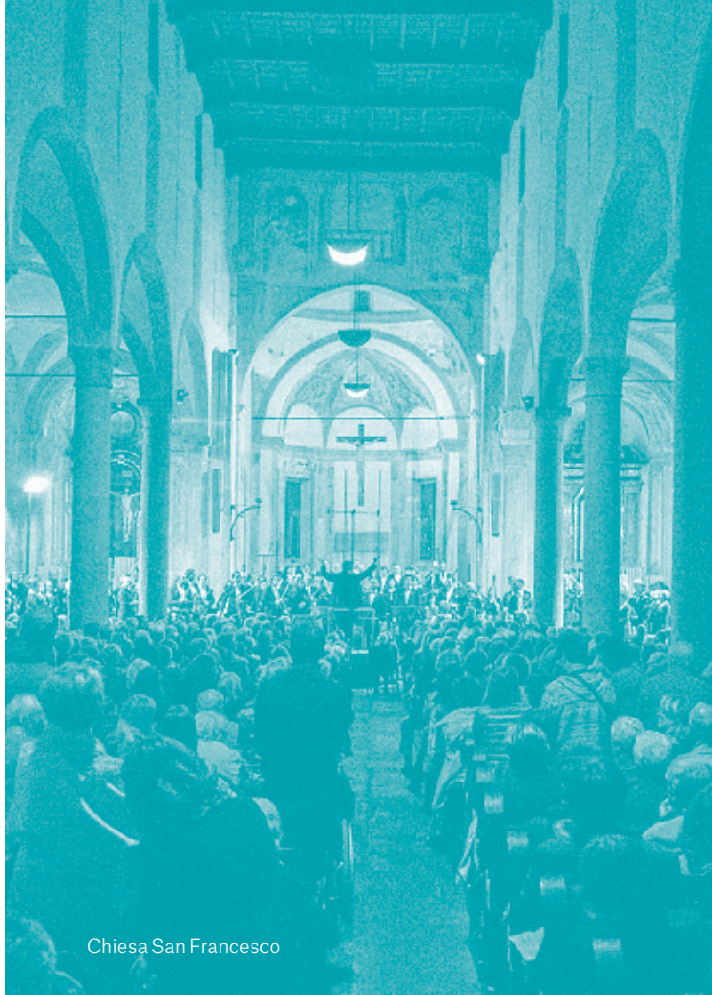
Chiesa San Francesco