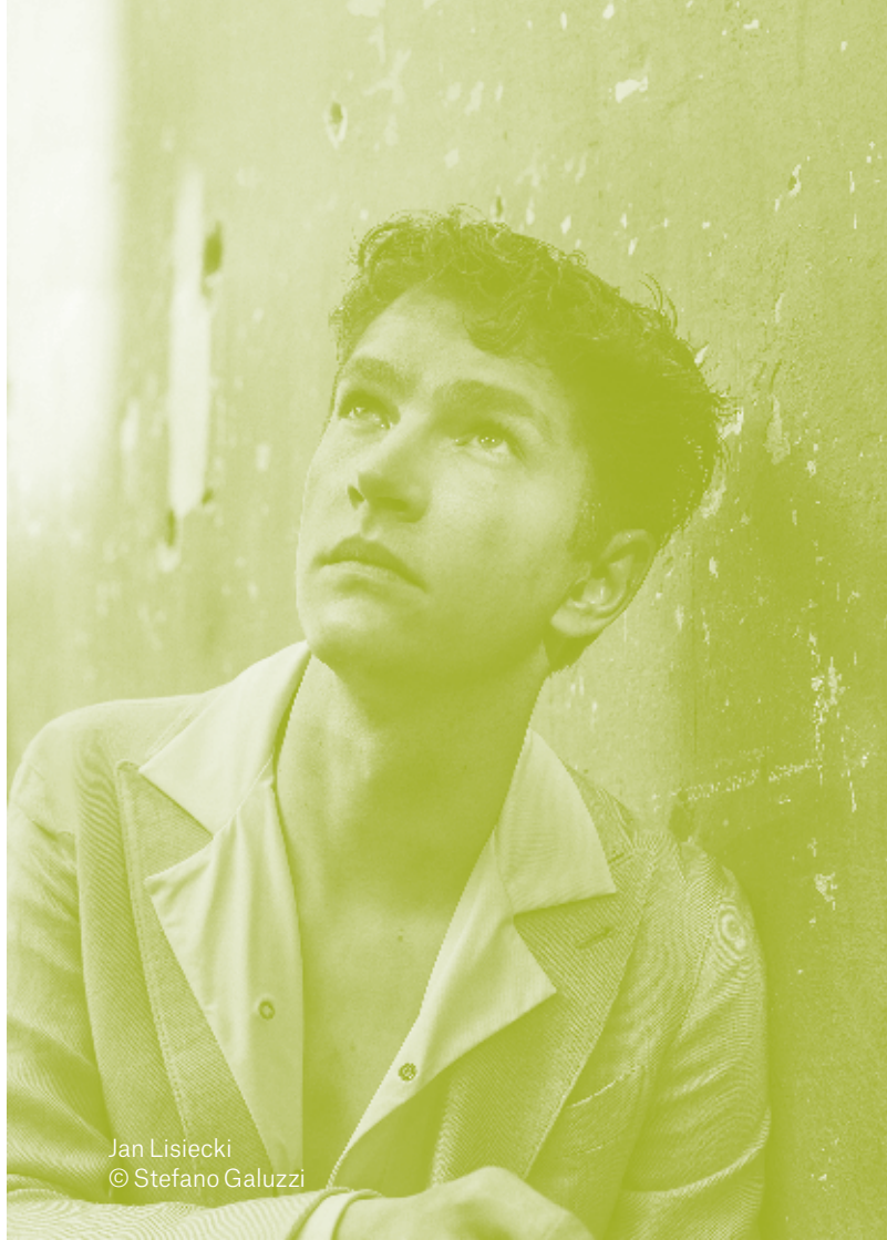
Jan Lisiecki