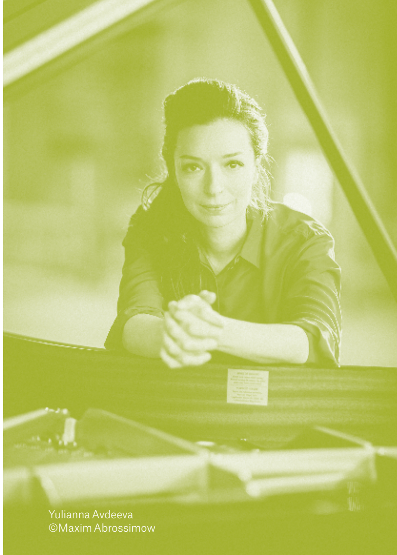
Yulianna Avdeeva