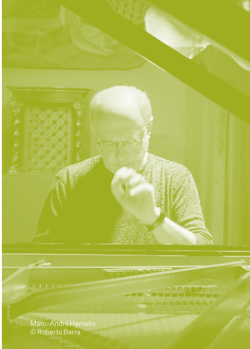
Marc-André Hamelin

Sonata n.2 in si bemolle minore, op.36 (versione 1931)