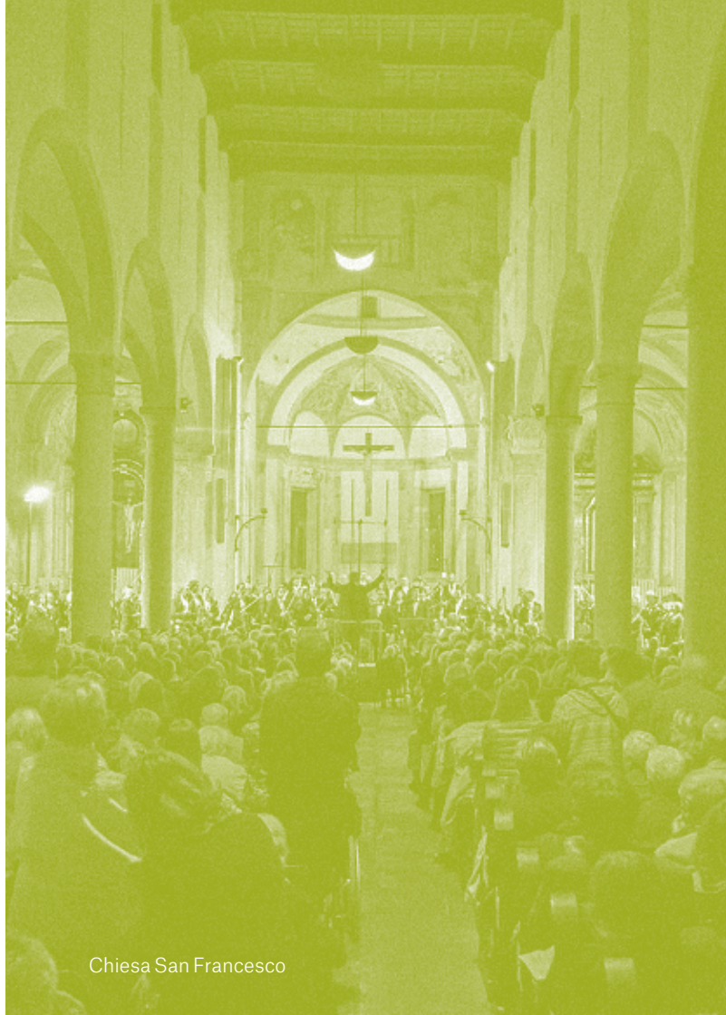
Chiesa San Francesco